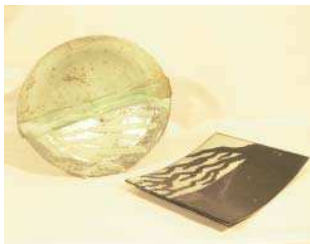
Por Thais Pimentel: no fusing , o vidro toma forma do molde e ganha cores de acordo com os pigmentos aplicados