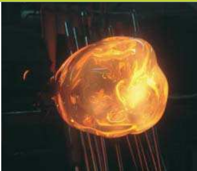
Na ponta da cana: bola incandescente e depois mais fria num trabalho de sopro no ateliê de Elvira Schuartz