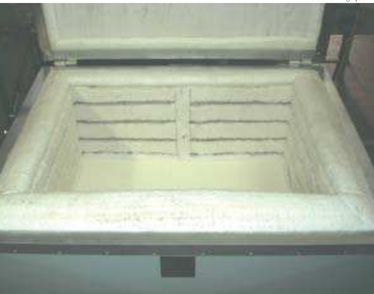
Has Fornos: equipamento é revestido de fibra de cerâmica para suportar altas temperaturas

vez para ela.” Em seguida, o rejunte de assentamento é aplicado e faz-se a limpeza. Os mosaicos têm aparecido bastante em janelas, portas e divisórias.