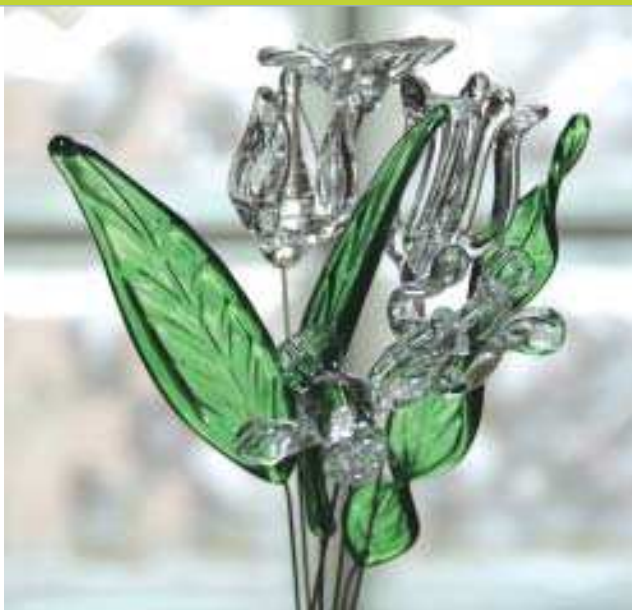
Ramo de flores só pôde ser produzido por Thaís Pimentel aplicando a técnica do maçarico